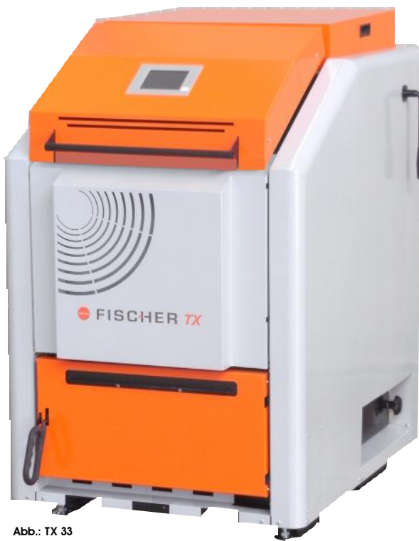
Abb.: TX 33