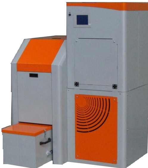
Abb.: PX 25

... Und zwar bei jedem Kesselstart wieder. Ein richtungsweisender, zum Patent angemeldeter Schieberrost löst nach jedem Ausbrand auch hartnäckigste Glutreste vom Rost. So stehen beim Neustart nur frische Pellets, ohne Rückstände bereit - das sorgt vom Start bis zum Ausbrand für äußerst sparsame und sauberste Verbrennung. Dadurch sind konstant niedrige Emissionen und höchste Wirkungsgrade garantiert, womit der Kessel für die höchsten Anforderungen der neuen 1.BImSchV Stufe 2 gerüstet ist. Neue mechanische und elektronische Sicherheitselemente erfüllen bereits heute die Sicherheitsvorschriften von morgen.